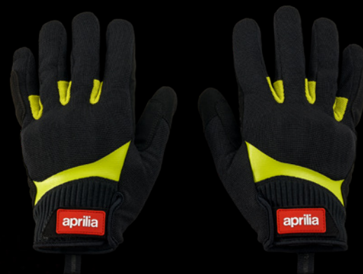
// GUANTES DEPORTIVOS