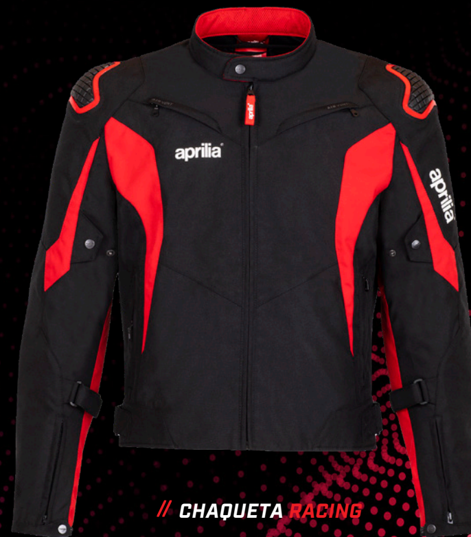
// CHAQUETA RACING